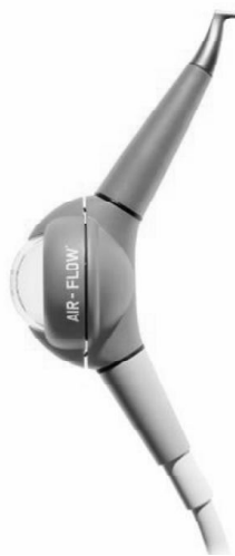
Рис. 1. Хендбластиер Air-Flow (EMS).

Всім пацієнтам для якісної ізоляції досліджуваних зубів застосовували кофердам. Потім очищували емаль оклюзійних поверхонь та фісури вище вказаними методами. При роботі з хендбластиерами Air-Flow (EMS), використовували в якості абразивного порошку Air-Flow