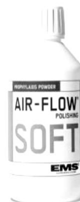
Рис. 2. Порошок Air Flow SOFT.